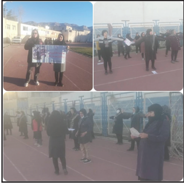
به منظور ترویج سبک زندگی سالم و فعالیت

گفتنی است، در حاشیه این برنامه توزیع بمفصلت‌های آموزشی، همچنین آموزش چهاره به چهاره در خصوص سرطان سینه، بیماری دیابت، فشارخون و معرفی بسته‌های خدمت میانسالان جهت مراجعه کنندگان به مراکز بهداشتی انجام گرفت.